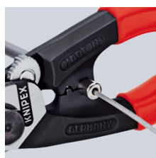
напрессовка наконечника на боуденовский трос