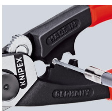
напрессовка концевой гильзы на тяговый трос