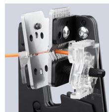
Удаление изоляции прецизионным профилем режущих лезвий точно по форме кабеля