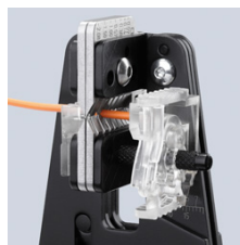
Ровное надрезание изоляции по всей окружности кабеля